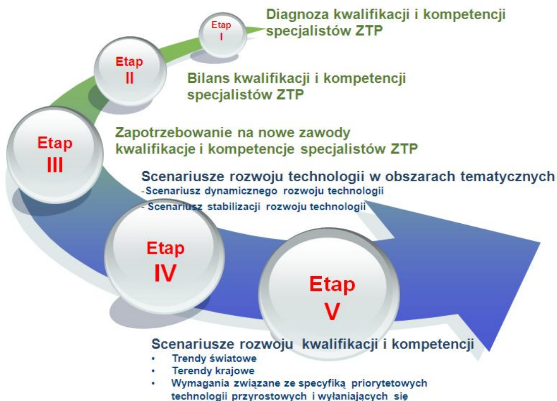
Rys. 1. Etapy prac w tworzeniu scenariuszy rozwoju społecznego (kwalifikacji i kompetencji)